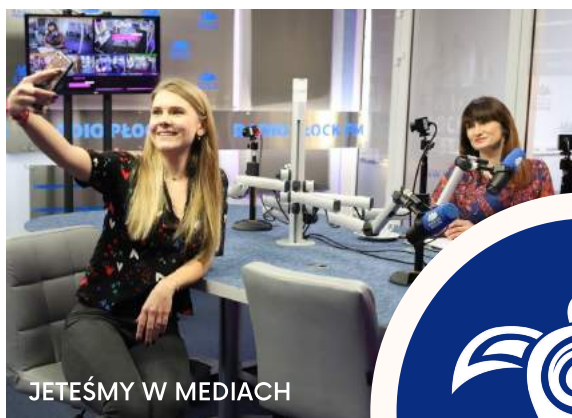
JETEŚMY W MEDIACH