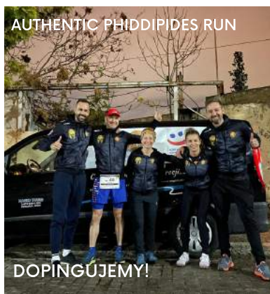
AUTHENTIC PHIDDIPIDES RUN