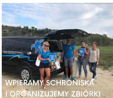
WPIERAMY SCHRONISKĄ I ORGANIZUJEMY ZBIÓRKI