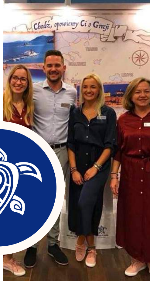
JESTEŚMY NA TARGACH Grecka Panorama 2017 i 2018